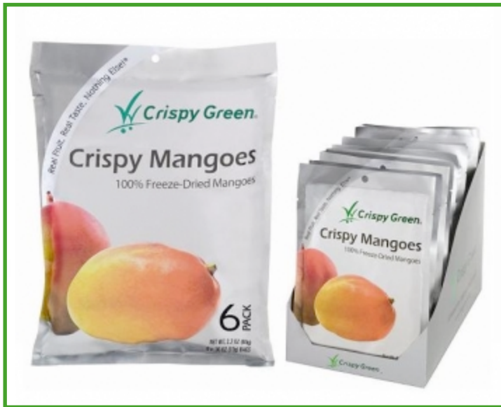
מקורות: Fresh Plaza, crispygreen.com , 27.5.2010