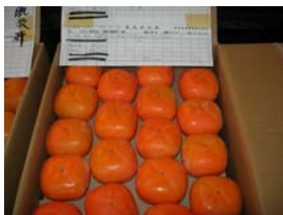
בתמונה למעלה: אפרסמונים בשוק הסיטוני OOTA ביפן, 13.10.2009.