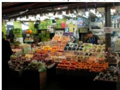
בתמונה למטה: חנות פירות ברובע היוקרתי GINZA בטוקיו, יפן, 19.10.2009. ניתן לראות אפרסמונים באריזת "מתנה" במגוון מחירים.

מחיר מכירה סיטוני 1,700 - 2,000 ין (80 - 68 ש"ח) לארגז שבתמונה.